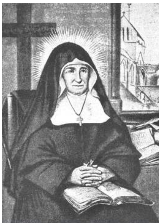
La Bienheureuse Marie-Madeleine Postel