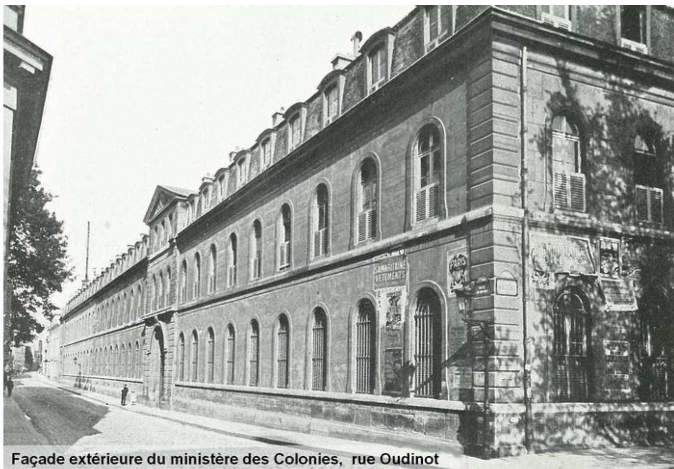
Façade extérieure du ministère des Colonies, rue Oudinot