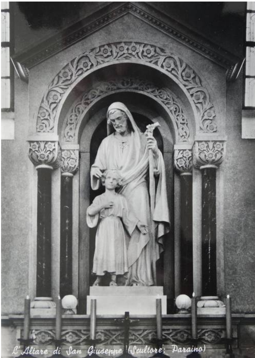
L'Altare di San Giuseppe (Scultore: Daraino)