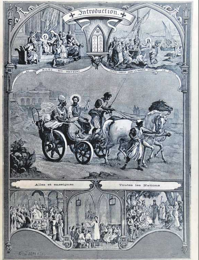
Catéchisme en images, Maison de la Bonne Presse, Paris, 1912. 70 gravures en noir et blanc avec explications de chaque tableau en regard.

22. Le signe de la croix, fait avec foi et piété, éloigne les dangers et les tentations et attire sur nous les bénédictions de Dieu.