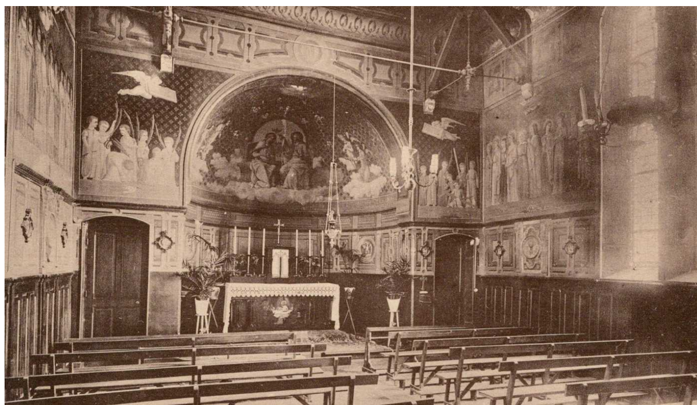
Ecole Saint Louis - LA ROCHE-sur-YON — Chapelle de l'Etablissement