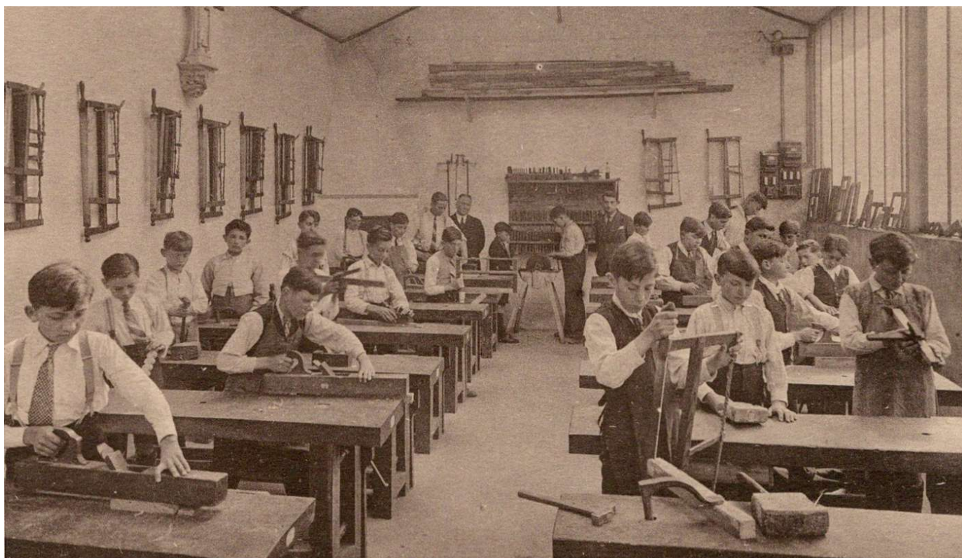
Ecole Saint Louis - LA ROCHE-sur-YON — Atelier de Menuiserie